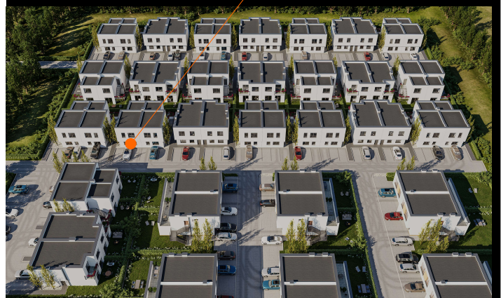
BUDYNEK 36F. lokal I

UL. PŁONOWA 36F NOWA WOLA - 57,1 m² KONDYGNACJA - PARTER