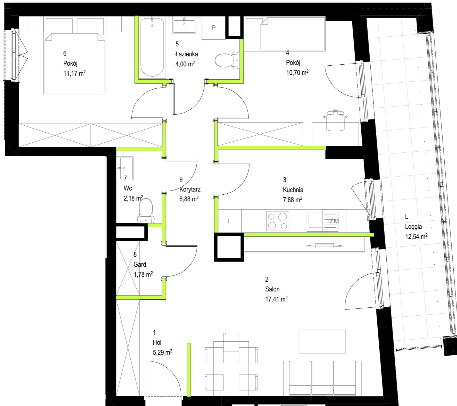
Przedstawiona na rzucie aranżacja ma charakter poglądowy