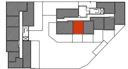
Położenie mieszkania w budynku

Warszawa, ul. Dionizosa 6A piętro 1 | klatka B