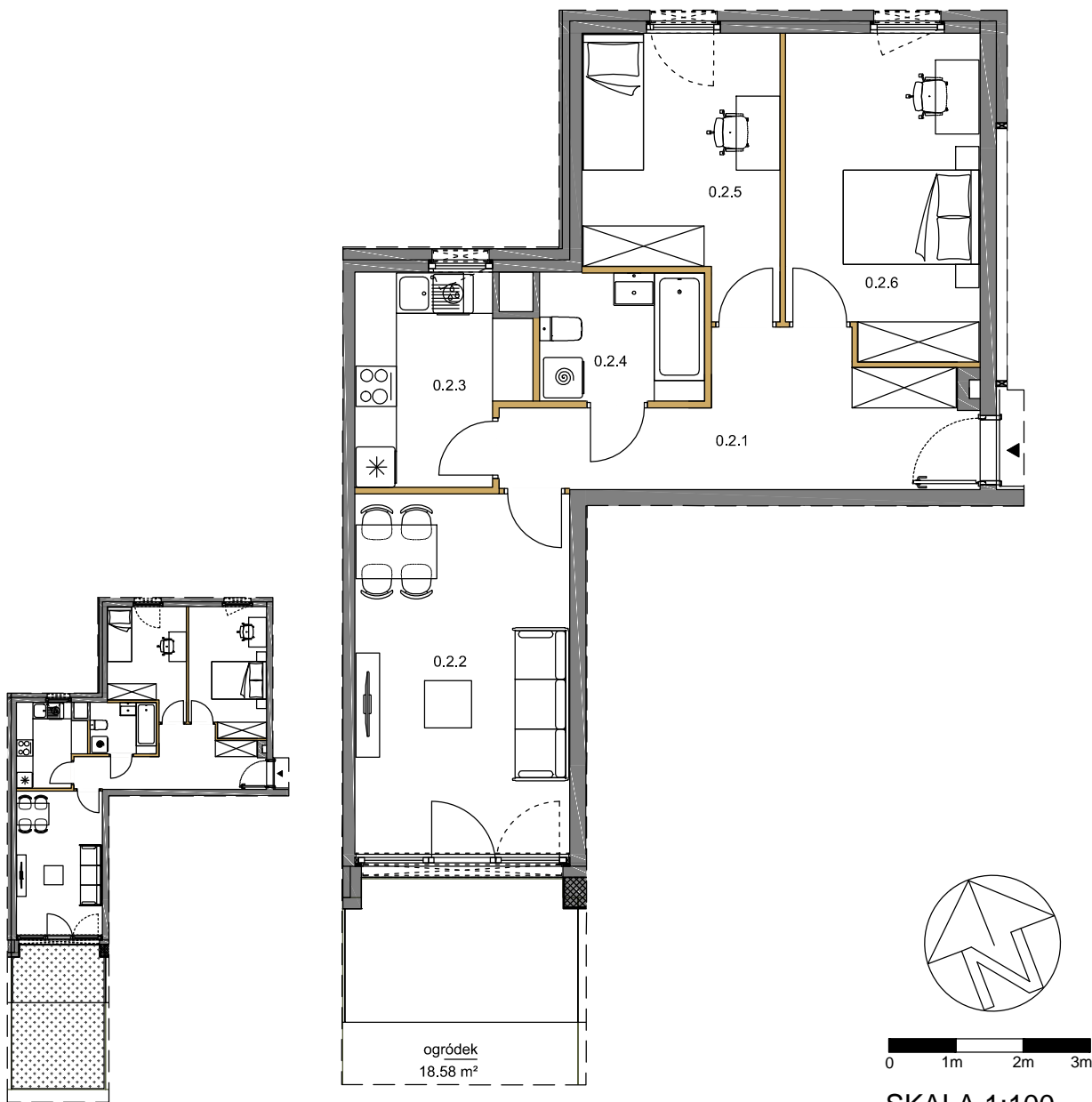
SCHEMAT MIESZKANIE + OGRÓDEK