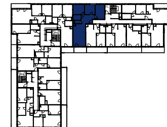
BUDYNEK A SCHEMAT