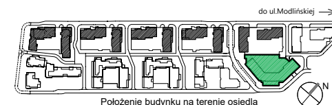
Położenie budynku na terenie osiedla