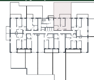
Rzut w skali 1:200