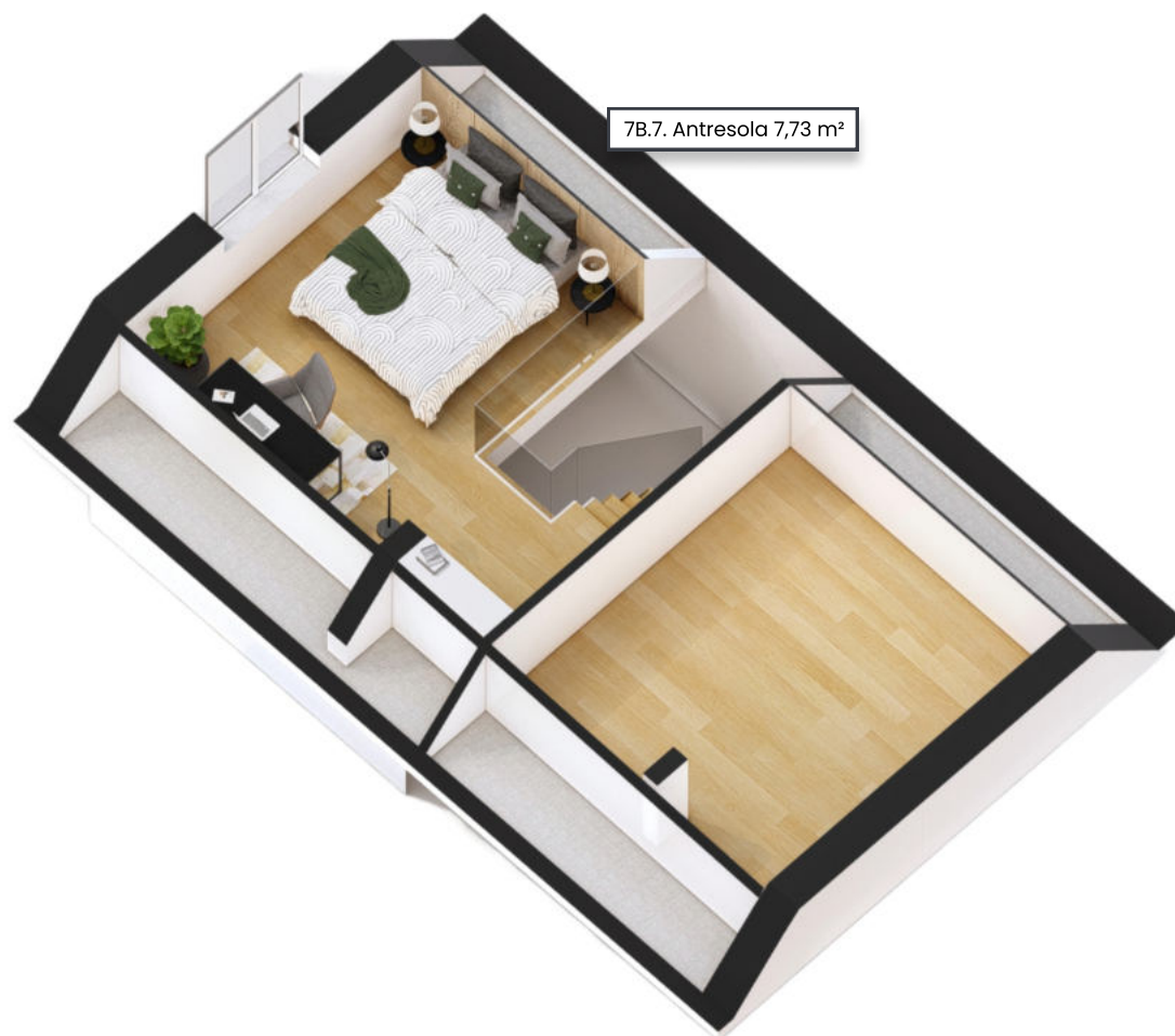
7B.7. Antresola 7,73 m 2