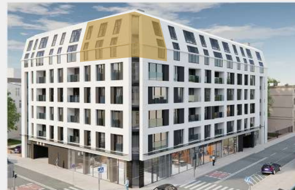
Rzut budynku od ul. Wólczańskiej