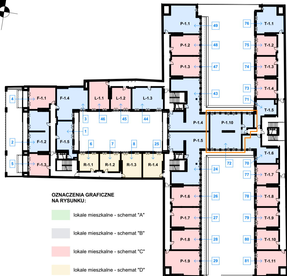
LOKALIZACJA LOKALU NA RZUCIE I PIĘTRA skala 1:500