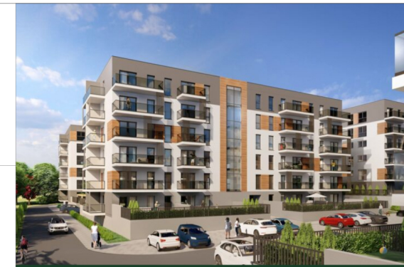
Schemat kondygnacji Parter