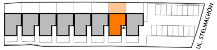
PLAN ZAGOSPODAROWANIA TERENU