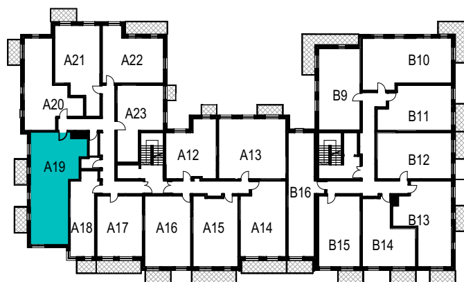
SCHEMAT ROZMIESZCZENIA LOKALI MIESZKALNYCH PIĘTRO I