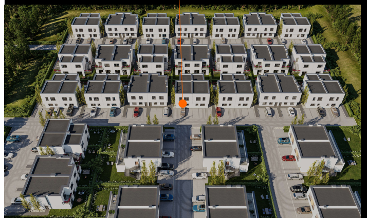
BUDYNEK 36K. lokal I

UL. PŁONOWA 36K NOWA WOLA - 57,1 m 2 KONDYGNACJA - PARTER