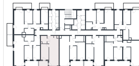
Rzut w skali 1:180