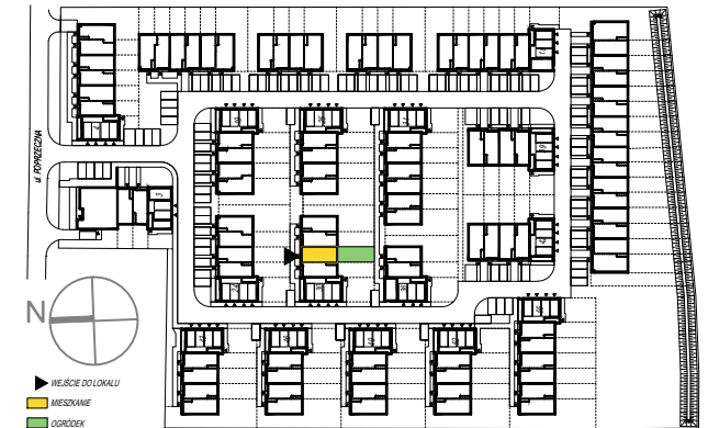
SCHEMAT PARTERU Z OGRÓDKAMI