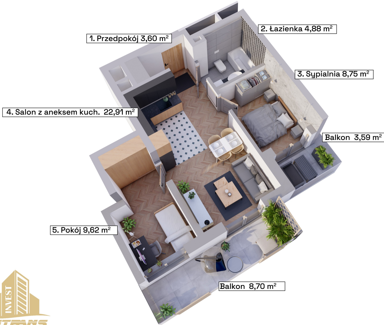
Schemat kondygnacji +4