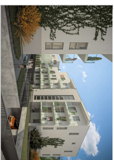
TEDEX RESIDENCE ETAP V Osiedle przy ul. Nowej 17 w Starej Wiczejnej