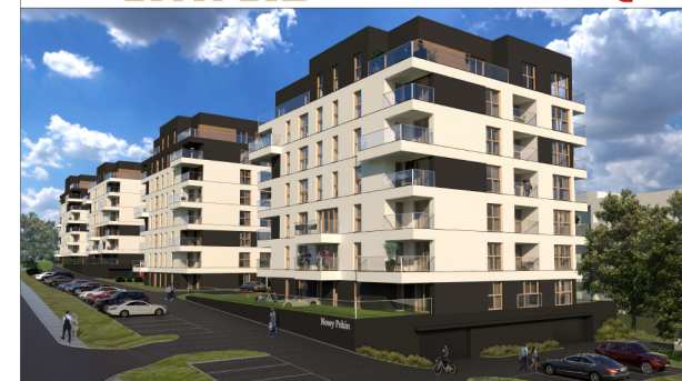
BUDYNEK D SCHEMAT LOKALIZACYJNY