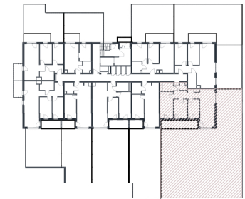
Rzut w skali 1:280