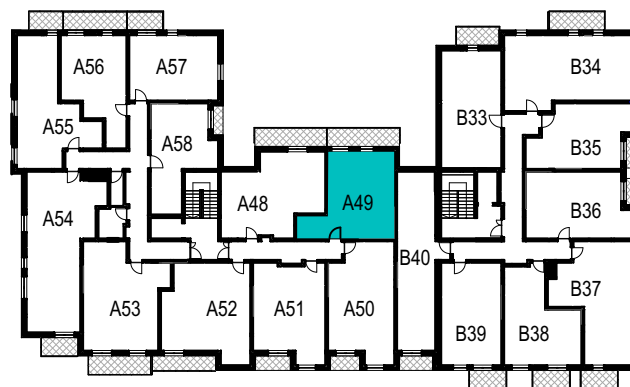
SCHEMAT ROZMIESZCZENIA LOKALI MIESZKALNYCH PIĘTRO IV