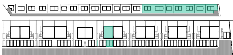
ZESPÓŁ 16 LOKAL A