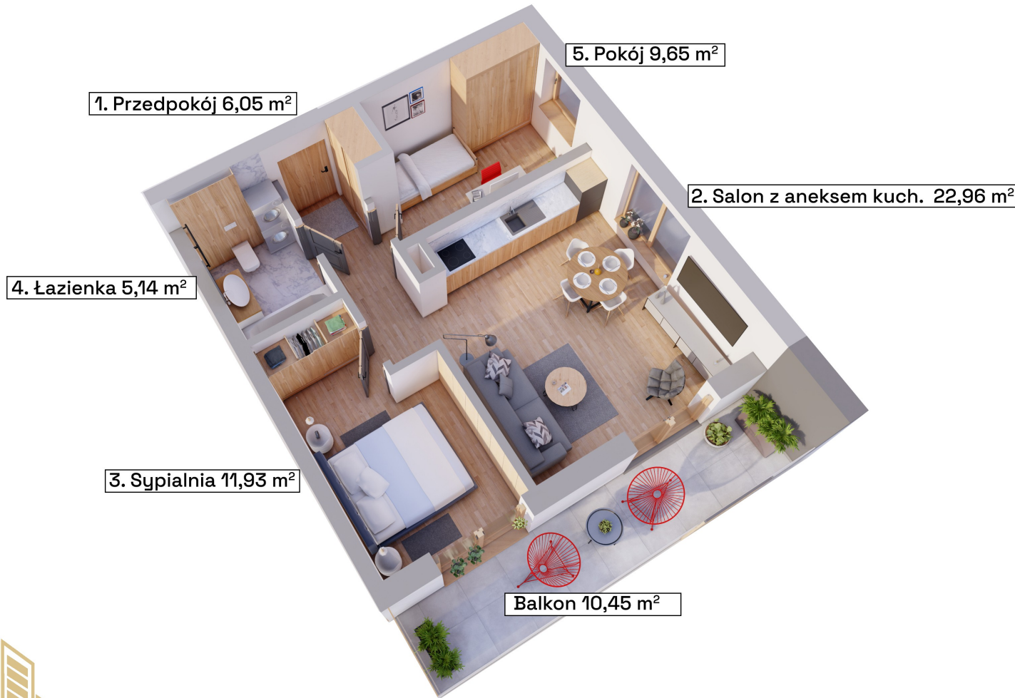
Schemat kondygnacji +1