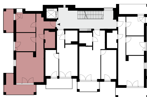
Rzut Piętra I