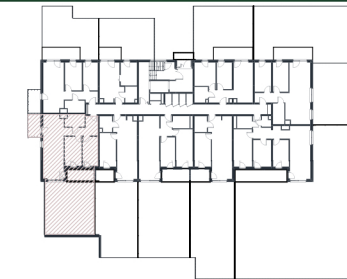
Rzut w skali 1:250