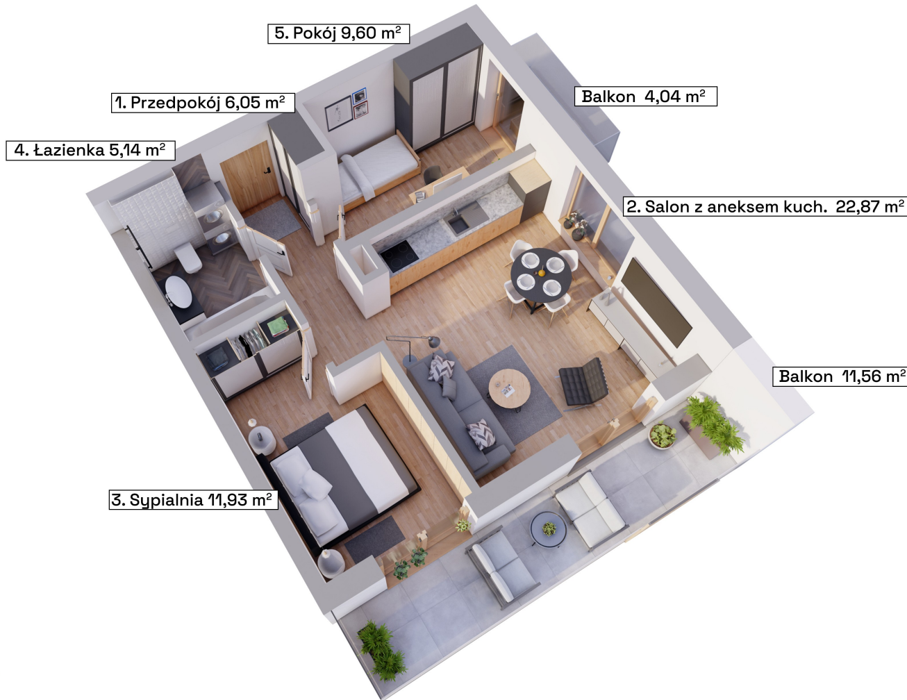
Schemat kondygnacji +4