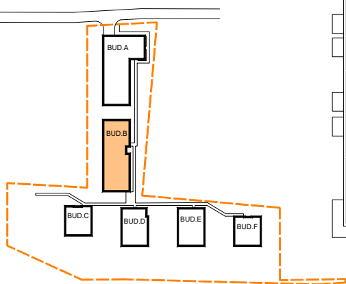
SCHEMAT LOKALIZACJI BUDYNKU