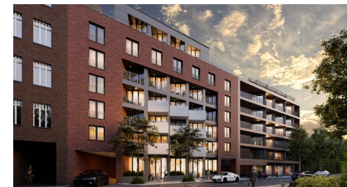
Widok od strony ulicy

Blisko najpiękniejszych miejsc w Warszawie, m.in. Stare Miasto, Bulwary nad Wisłą czy Park Praski