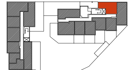
Położenie mieszkania w budynku