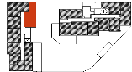
Położenie mieszkania w budynku

Warszawa, ul. Dionizosa 6A piętro 1 | klatka A