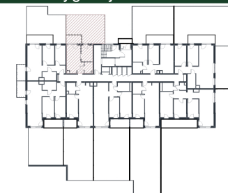
Rzut w skali 1:200