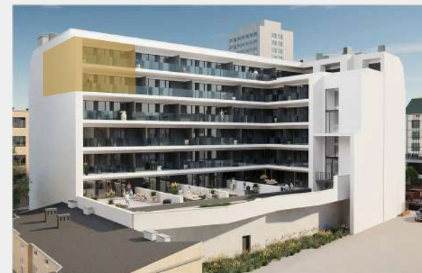
Rzut budynku od strony wewnętrznej