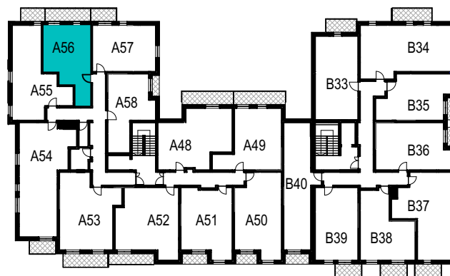
SCHEMAT ROZMIESZCZENIA LOKALI MIESZKALNYCH PIĘTRO IV