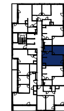
BUDYNEK B SCHEMAT