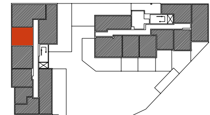
Położenie mieszkania w budynku

Warszawa, ul. Dionizosa 6A piętro 1 | klatka A