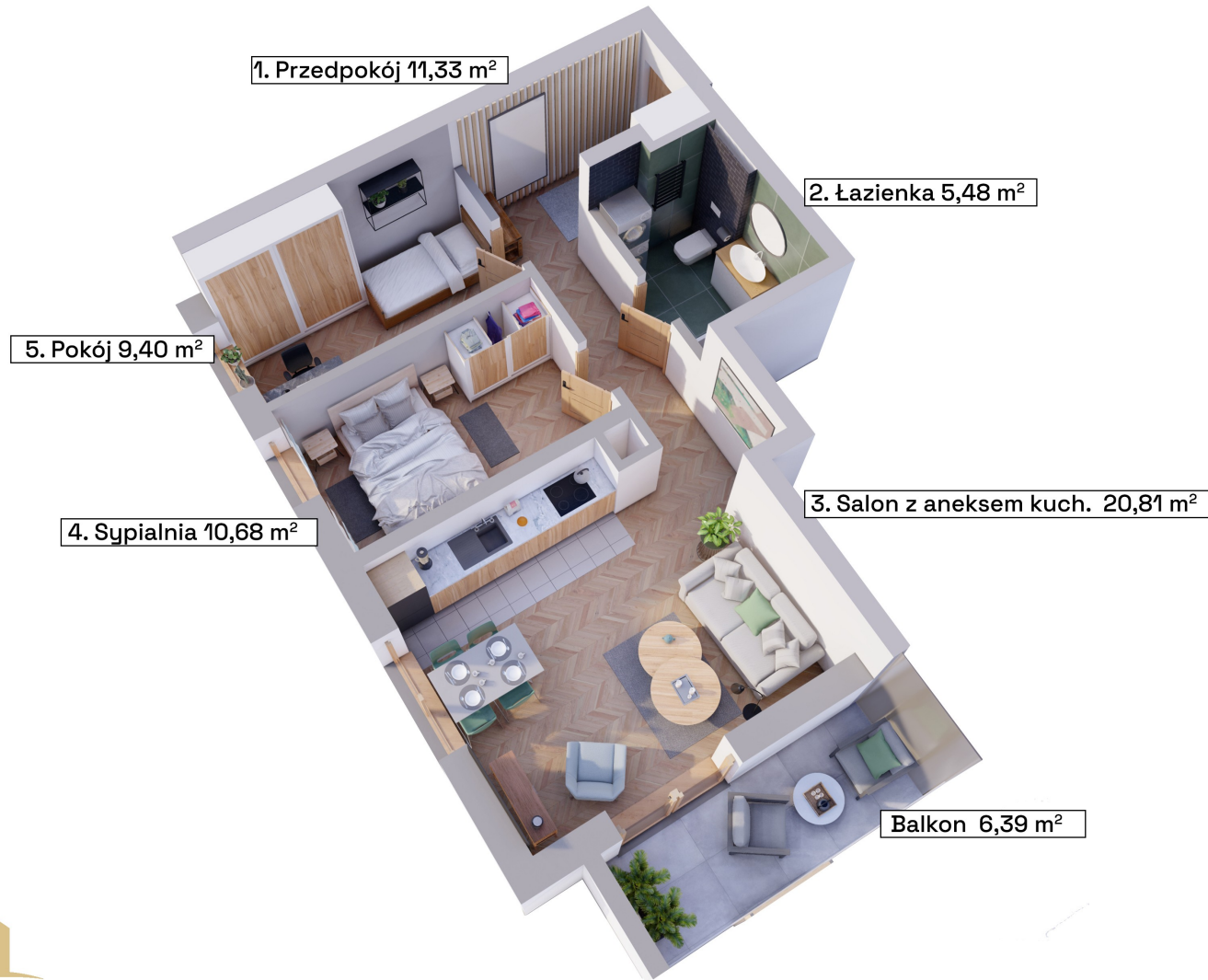
Schemat kondygnacji +1