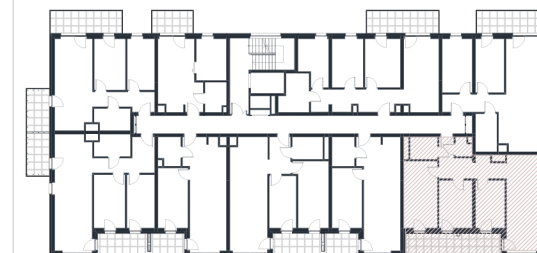
Rzut w skali 1:225