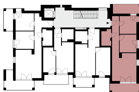
Rzut Piętra I