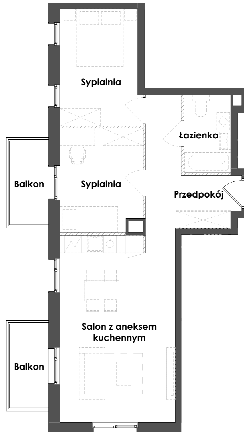
Przykładowa aranżacja lokalu