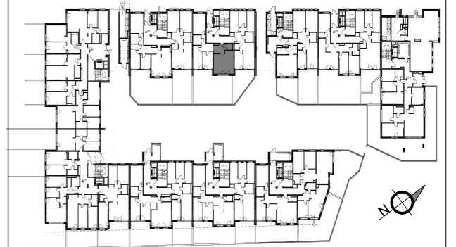
SCHEMAT KONDYGNACJI - PARTER