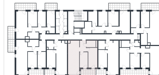
Rzut w skali 1:200