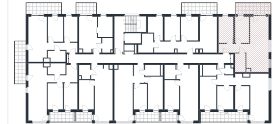
Rzut w skali 1:220