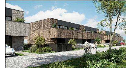
SCHEMAT INWESTYCJI- BUDYNEK B