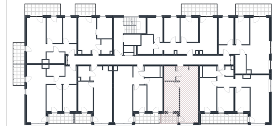
Rzut w skali 1:180