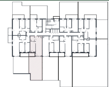
Rzut w skali 1:200