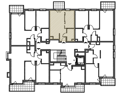
Rzut w skali 1:150