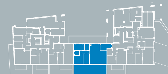
BUDYNEK D SCHEMAT

Ściany konstrukcyjne i kominy - elementy stałe Ściany działowe nadające się do demontażu.