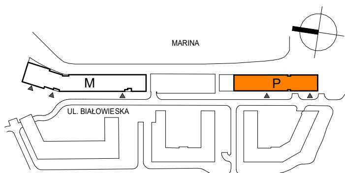
SCHEMAT LOKALIZACJI BUDYNKU