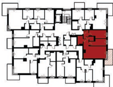
LOKALIZACJA MIESZKANIA W BUDYNKU