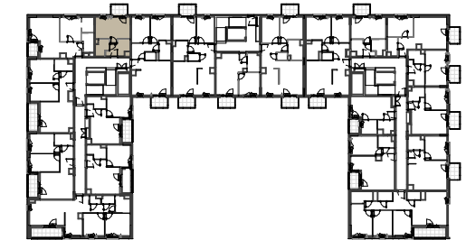
Rzut piętra 5